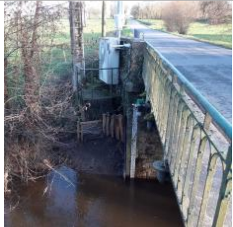
Station Vigicrues de la Flume à Pacé