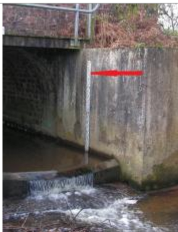
Echelle limnimétrique de la station Vigicruces de la Chèze à Plélan

Altitude calculée de l'eau (en m) : 89.508 m