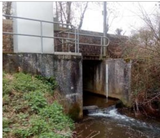
Station limnimétrique de la Chèze à Plélan-le-grand