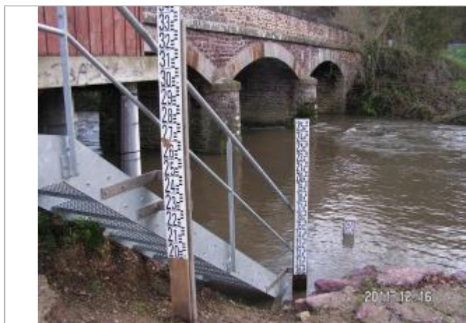
Echelles limnimétriques de la station Vigicrues du Meu à Montfort

Altitude calculée de l'eau (en m) : 32.279 m