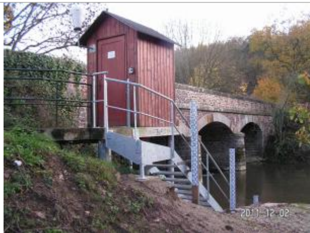
Vue du site de la station Vigicrues de Montfort sur Meu Abbaye