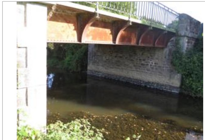
Vue du site de la station Vigicrues sous le pont de la RD 31

Coordonnées WGS84 : X: -1.99364650 / Y: 48.17001300