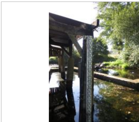
Echelle limnimétrique de la station Vigicrues du Meu à Gael

Altitude calculée de l'eau (en m) : 59.079 m