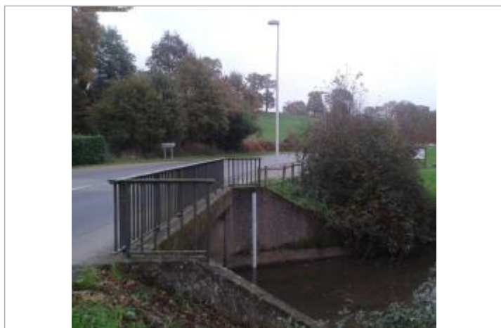
Echelle limnimétrique de la station Vigicrues à Bourg-Barré

Différence entre le niveau d'eau et la référence (en m) : 1.500 m