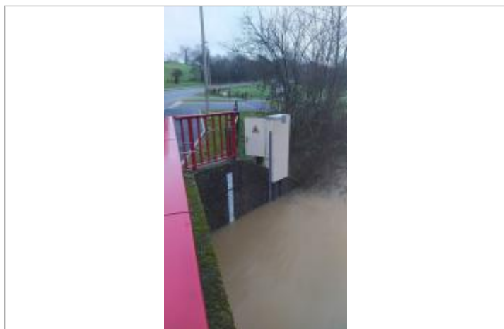
Station de l'Ise à Bourg-Barré (photo prise le 25/01/2025 pas au maximum de la crue)

Différence entre le niveau d'eau et la référence (en m) : 2.100 m