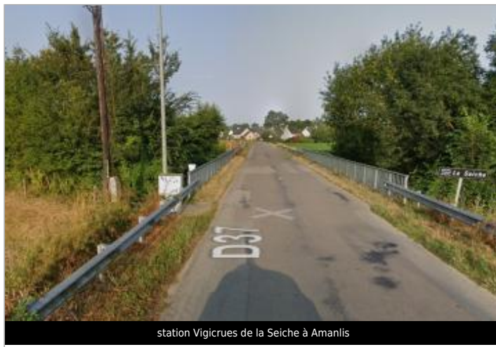
station Vigicrues de la Seiche à Amanlis