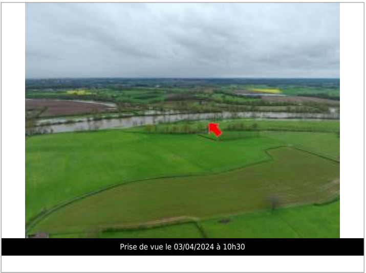
Prise de vue le 03/04/2024 à 10h30