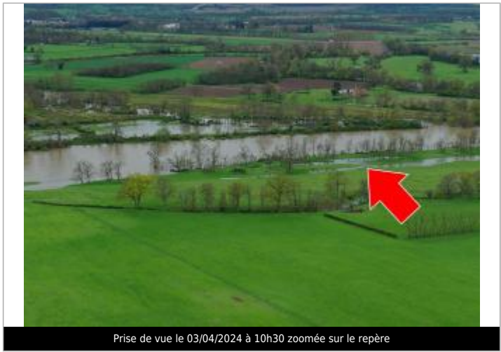
Prise de vue le 03/04/2024 à 10h30 zoomée sur le repère