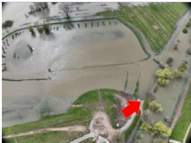
Prise de vue le 04/04/2024 à 14h16 zoomée sur le repère