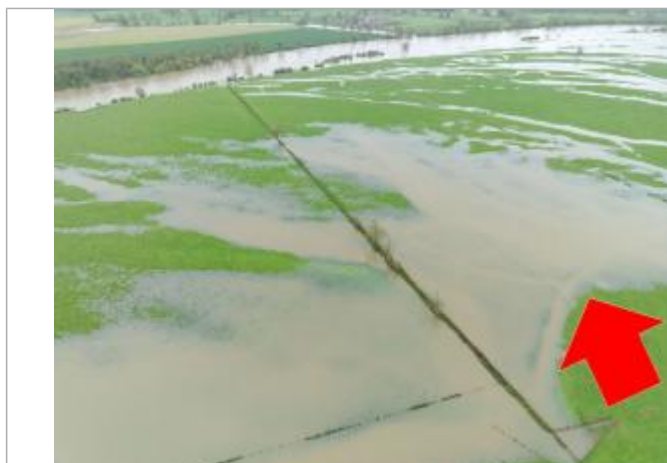
Prise de vue le 03/04/2024 à 10h12 zoomée sur le repère