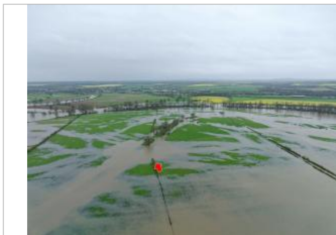
Prise de vue le 03/04/2024 à 10h07 zoomée sur le repère