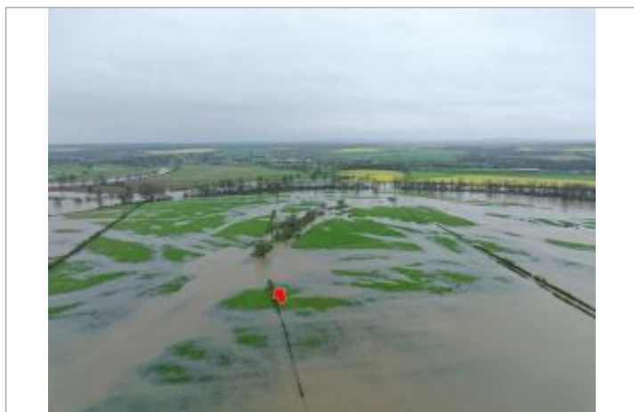
Prise de vue le 03/04/2024 à 10h07 zoomée sur le repère