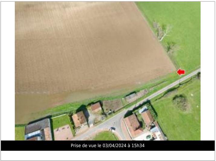
Prise de vue le 03/04/2024 à 15h34