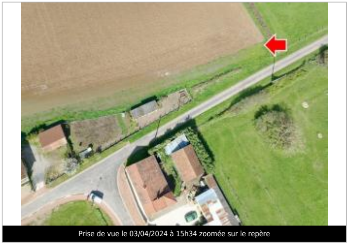
Prise de vue le 03/04/2024 à 15h34 zoomée sur le repère