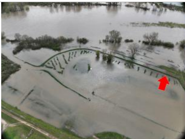
Prise de vue le 04/04/2024 à 14h15 zoomée sur le repère