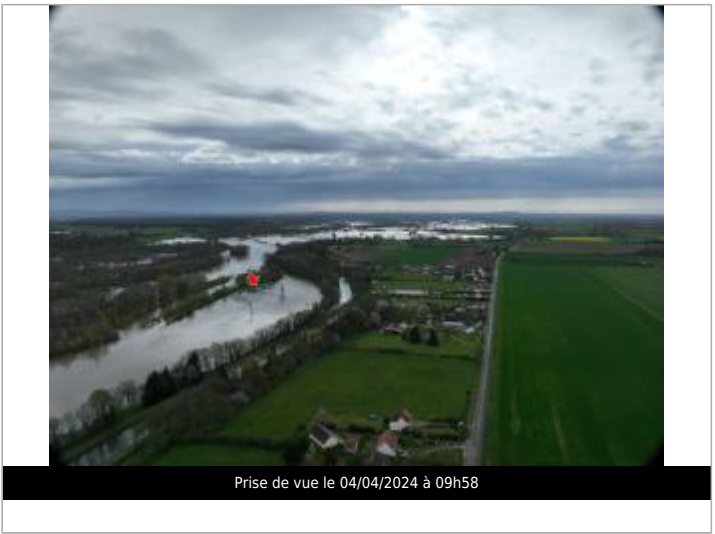
Prise de vue le 04/04/2024 à 09h58