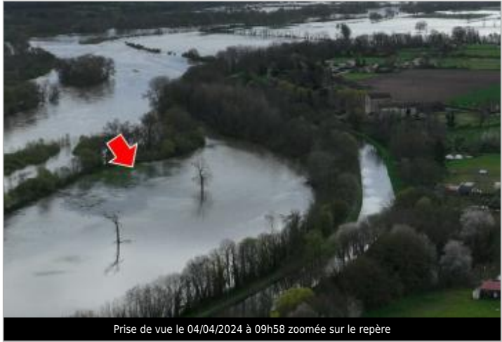
Prise de vue le 04/04/2024 à 09h58 zoomée sur le repère