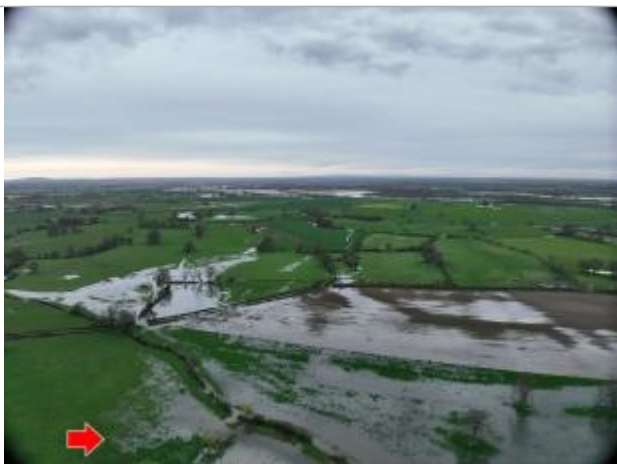
Prise de vue le 04/04/2024 à 07h52 zoomée sur le repère

Altitude calculée de l'eau (en m) : 193.46