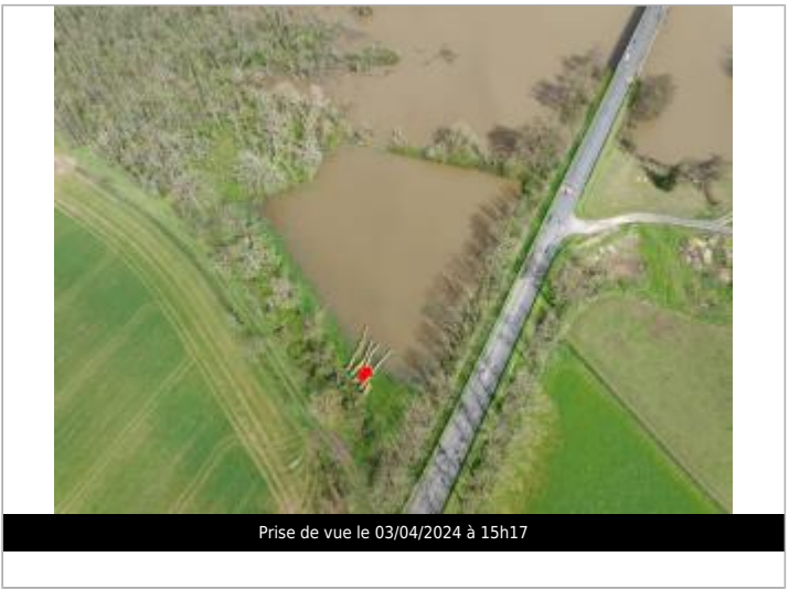
Prise de vue le 03/04/2024 à 15h17