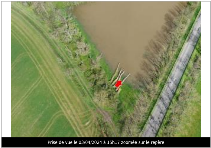
Prise de vue le 03/04/2024 à 15h17 zoomée sur le repère