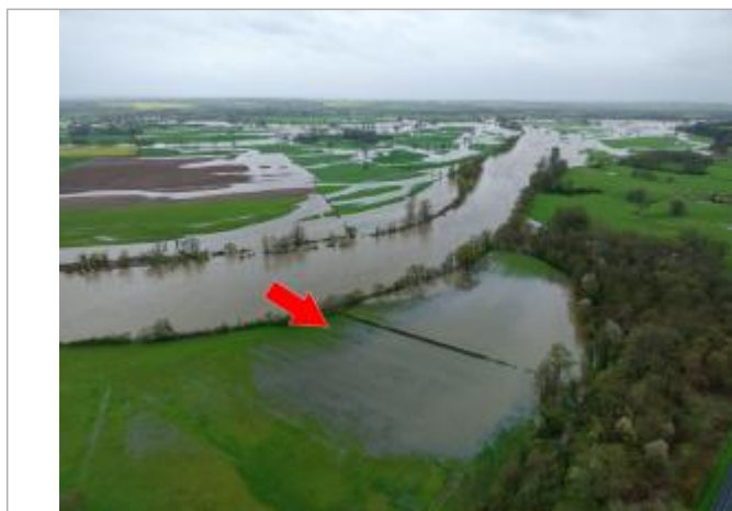
Prise de vue le 03/04/2024 à 09h38 zoomée sur le repère