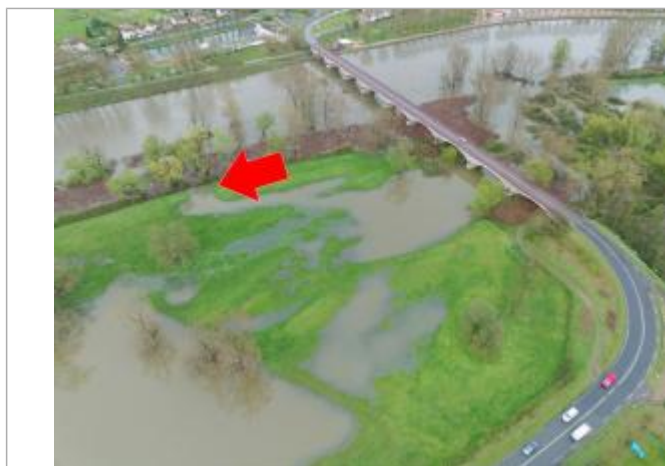
Prise de vue le 03/04/2024 à 08h12 zoomée sur le repère