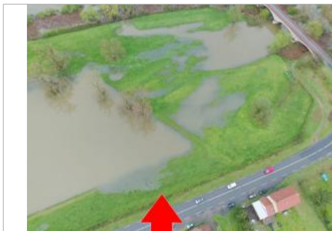
Prise de vue le 03/04/2024 à 08h12 zoomée sur le repère