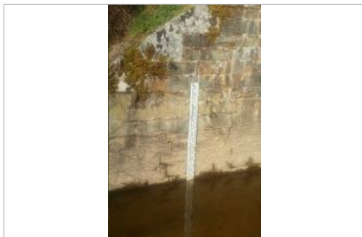
Echelle limnimétrique de la Cantache à Taillis

Altitude calculée de l'eau (en m) : 75.771 m