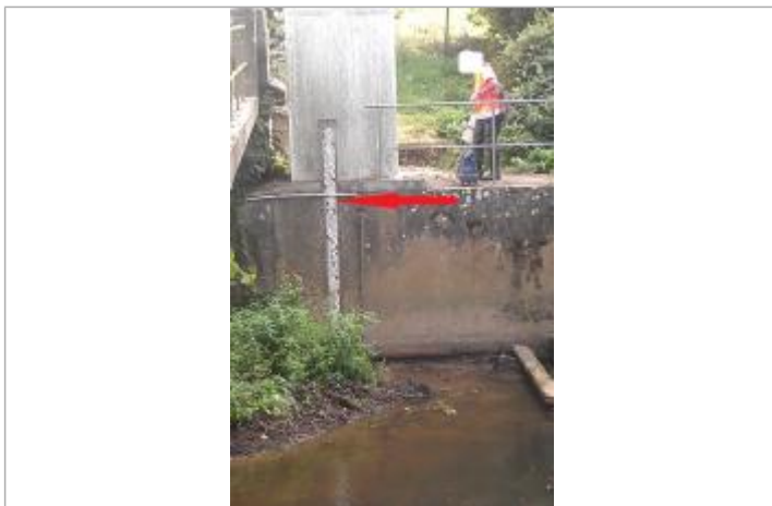
Echelle limnimétrique du Chevré (Veuvre) - Le Drujeon