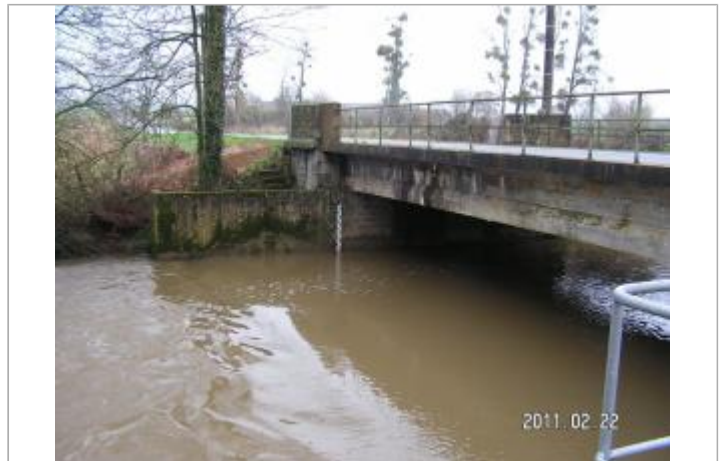
Station limnimétrique du Chevré (Veuvre) - Le Drujeon

Coordonnées WGS84 : X: -1.49856639 / Y: 48.18313600