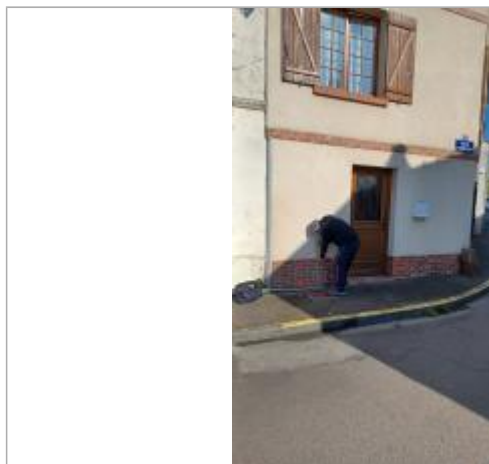
Laisse de crue à environ 45 cm/sol.

SOURCE DE REPÉRAGE : VISITE DE TERRAIN SPC SACN - 11/03/2020