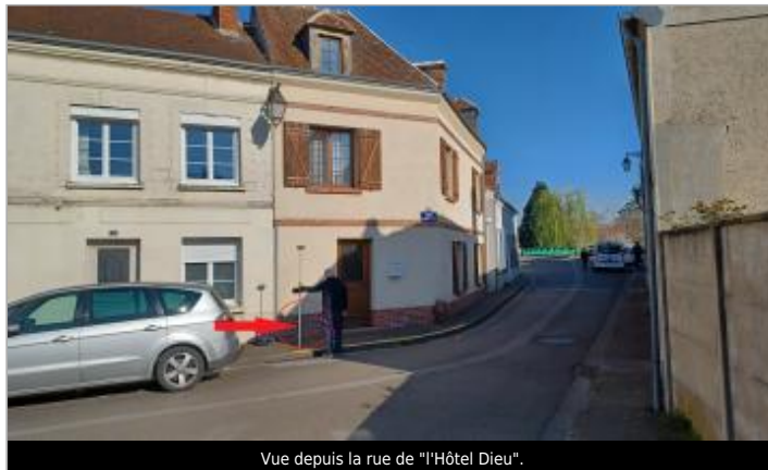
Vue depuis la rue de "L'Hôtel Dieu".