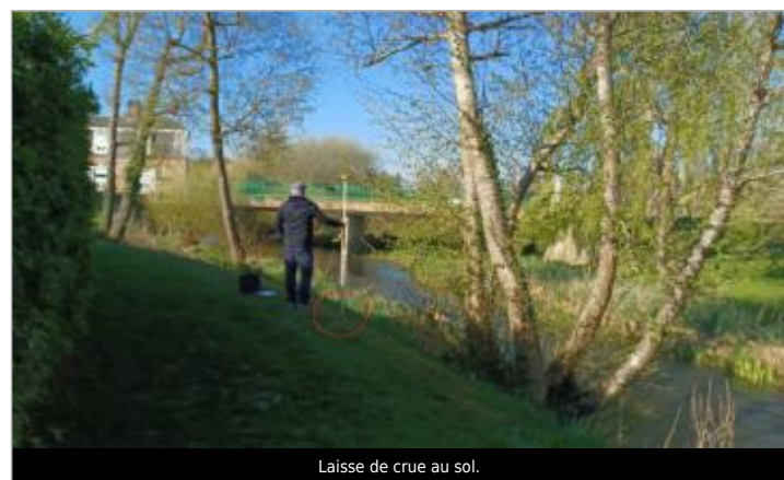
Laisse de crue au sol.

GÉNÉRAL Code : WEB_R_202504105814 Date de mise à jour : 10/04/2025 Auteur : SPC.SACN