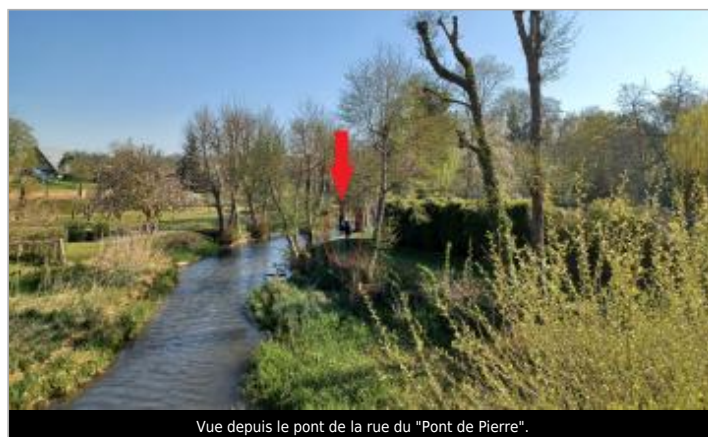
Vue depuis le pont de la rue du "Pont de Pierre".

GÉOLOCALISATION Coordonnées WGS84 : X: 1.07240305 / Y: 48.87153490 Coordonnées RGF93 (Lambert 93) X: 558619.58 / Y: 6865226.73 Coordonnées RGF93 (ETRS89) : X: 1.0724031 / Y: 48.8715349 Code Hydro: H43-0400 Rive de référence: Droite