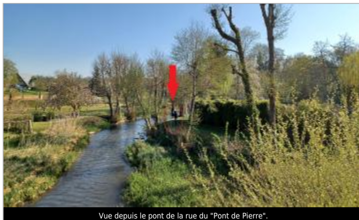
Vue depuis le pont de la rue du "Pont de Pierre".