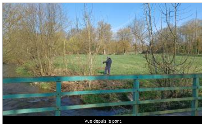
Vue depuis le pont.

GÉOLOCALISATION Coordonnées WGS84 : X: 1.07562835 / Y: 48.91083500 Coordonnées RGF93 (Lambert 93) X: 558962.59 / Y: 6869589.77 Coordonnées RGF93 (ETRS89) : X: 1.0756284 / Y: 48.910835 Code Hydro: H43-0400 Rive de référence: Droite