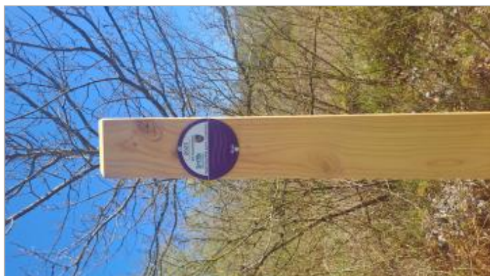
repère de la crue de l'Arve du 14 novembre 2023