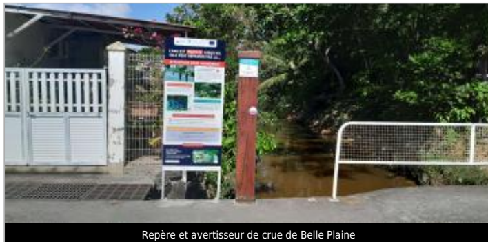
Repère et avertisseur de crue de Belle Plaine

Coordonnées WGS84 : X: -61.49458800 / Y: 16.21667900