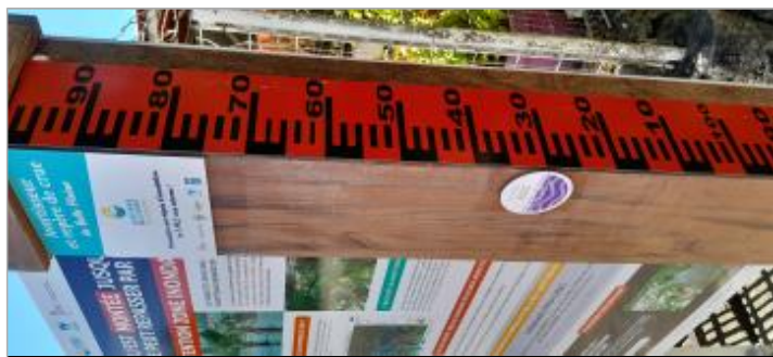
Macaron et échelle limnimétrique