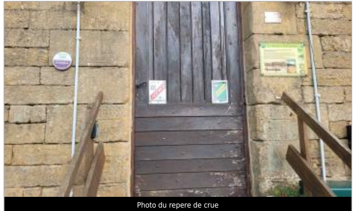
Photo du repere de crue