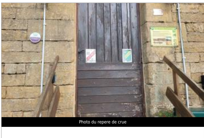
Photo du repere de crue