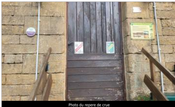
Photo du repere de crue

Coordonnées WGS84 : X: 1.33638058 / Y: 44.85177410