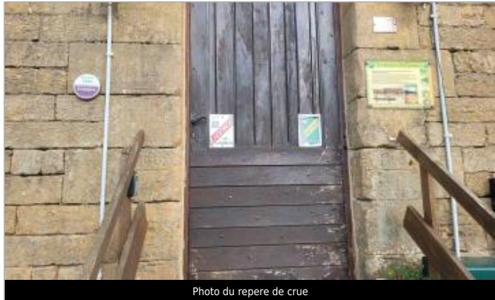
Photo du repere de crue