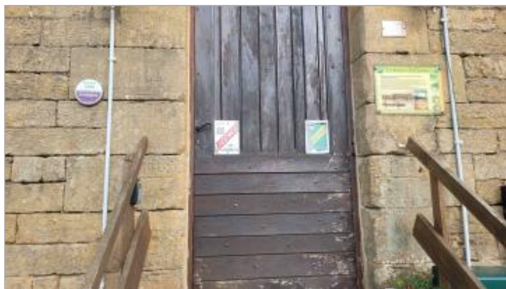
Photo du repere de crue

Altitude calculée de l'eau (en m) : 83.72