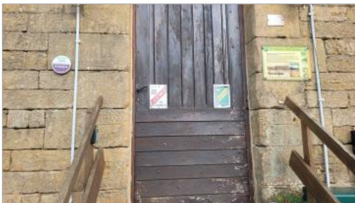
Photo du repere de crue

Méthode : Inconnue Référence nivelée : Non renseigné Système altimétrique : NGF IGN 1969 (système normal) Altitude de la référence (en m) : 83.720 m Altitude calculée de l'eau (en m) : 83.72