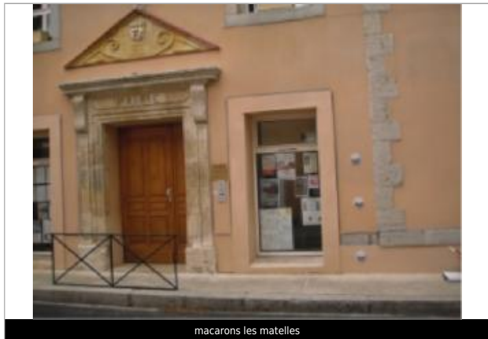
macarons les matelles