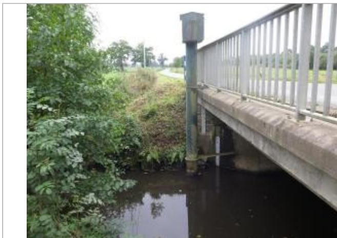
Station limnimétrique de la Vilaine à Bourgon en 2017