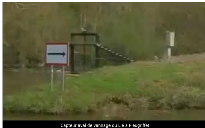
Capteur aval de vannage du Lié à Pleugriffet

Coordonnées WGS84 : X: -2.65923467 / Y: 48.00881480