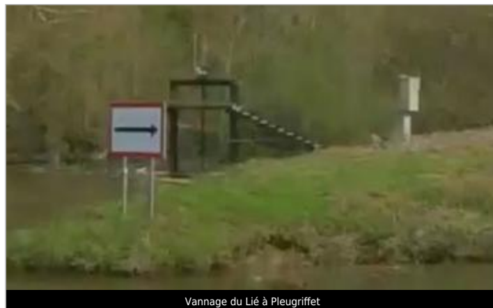
Vannage du Lié à Pleugriffet

Coordonnées WGS84 : X: -2.65927508 / Y: 48.00882790