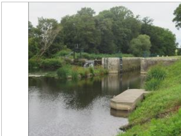
Ecluse de Grenouilliere aval à Bréhan

Coordonnées WGS84 : X: -2.67843743 / Y: 48.01832370