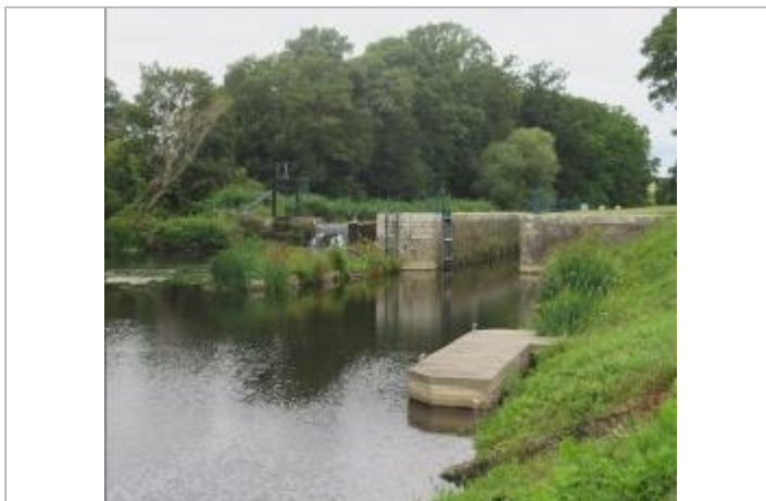
Ecluse de Grenouillere aval à Bréhan