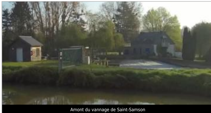
Amont du vannage de Saint-Samson

Coordonnées WGS84 : X: -2.76571558 / Y: 48.08447710