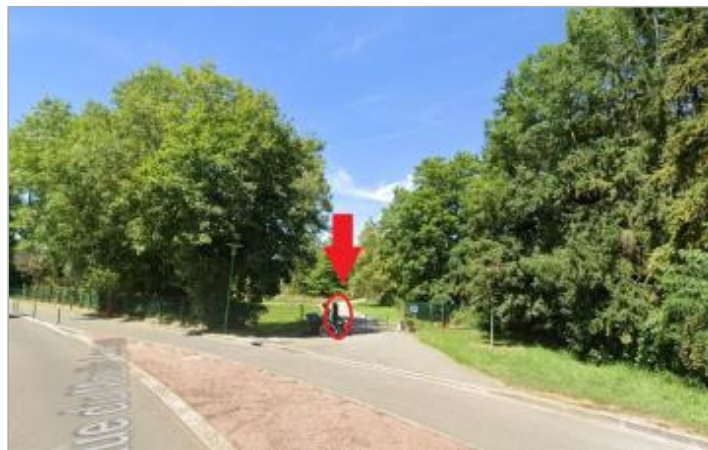
Vue depuis la rue du Moulin Lecomte.

GÉNÉRAL Unité de gestion : Seine aval-Côtiers Normands Code : WEB_S_202503252035 Date de mise à jour : 25/03/2025 Auteur : SPC.SACN