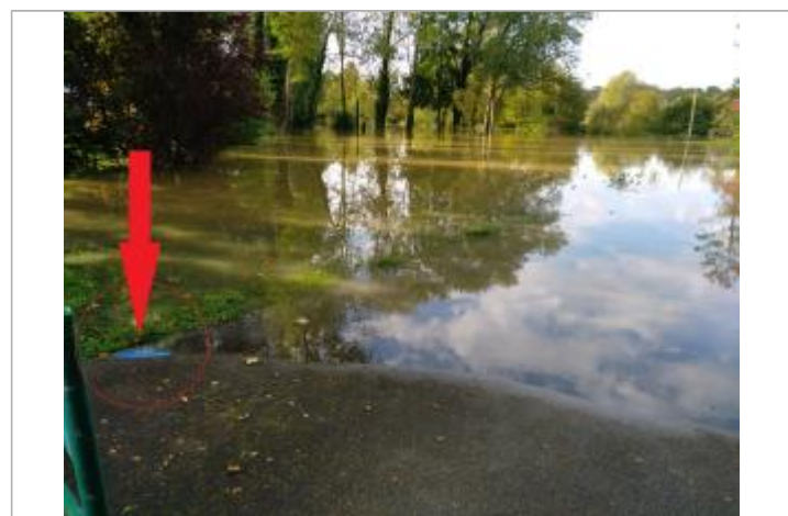
Laisse de crue au sol.

MARQUE Maximum de l'inondation : Oui Visibilité : Oui État du repère : Moyen Pérennité : Moyenne Repère calculé : Non PHEC : Non