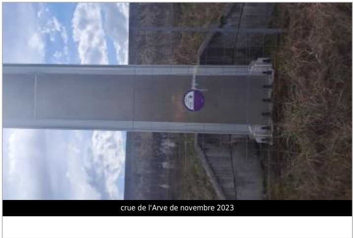
crue de l'Arve de novembre 2023