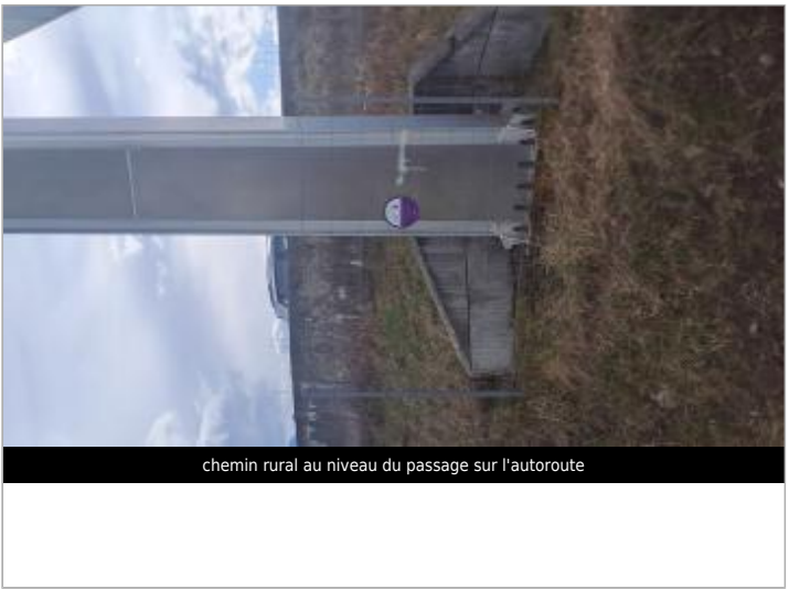
chemin rural au niveau du passage sur l'autoroute