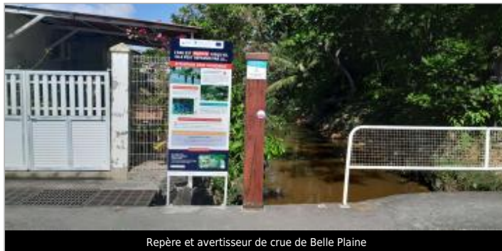
Repère et avertisseur de crue de Belle Plaine