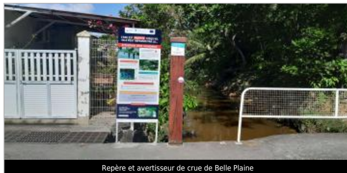
Repère et avertisseur de crue de Belle Plaine

Coordonnées WGS84 : X: -61.49458800 / Y: 16.21667900