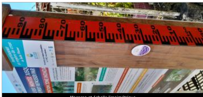
Macaron et échelle limnimétrique

SOURCE DE REPÉRAGE : COMMUNAUTÉ D'AGGLOMÉRATION LA RIVIÈRE DU LEVANT -