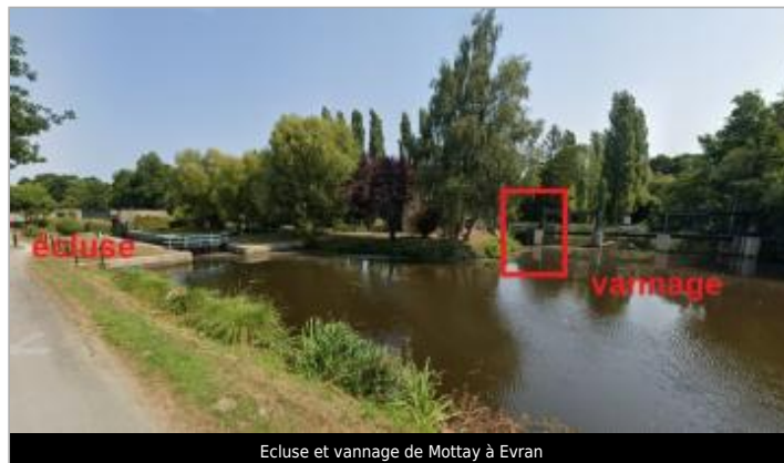
Ecluse et vannage de Mottay à Evran

Coordonnées WGS84 : X: -2.00620090 / Y: 48.40215860