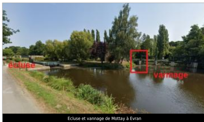
Ecluse et vannage de Mottay à Evran

GÉOLOCALISATION Coordonnées WGS84 : X: -2.00620090 / Y: 48.40215860 Coordonnées RGF93 (Lambert 93) X: 329721.41 / Y: 6823060.18 Coordonnées RGF93 (ETRS89) : X: -2.0062009 / Y: 48.4021586 Code Hydro: J0--0160 Rive de référence: Gauche