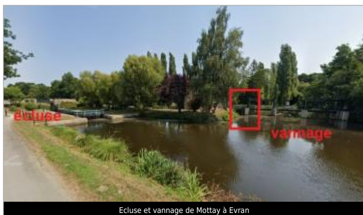
Ecluse et vannage de Mottay à Evran