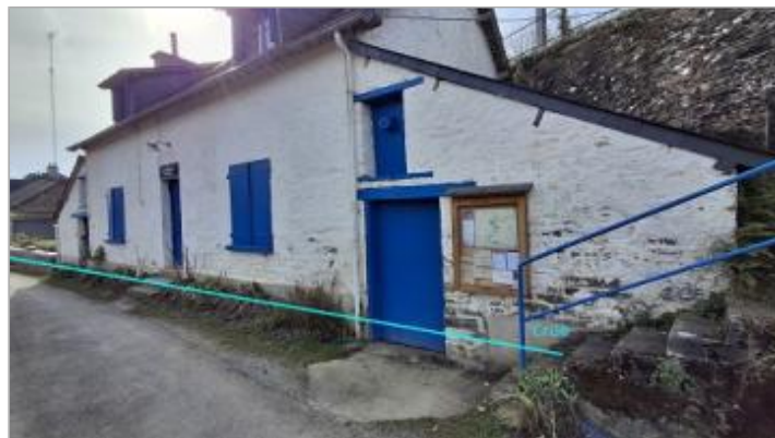
Maison éclusière de La Bouexière avec niveau de la crue de janvier 2025

Coordonnées WGS84 : X: -1.75199956 / Y: 47.94532590