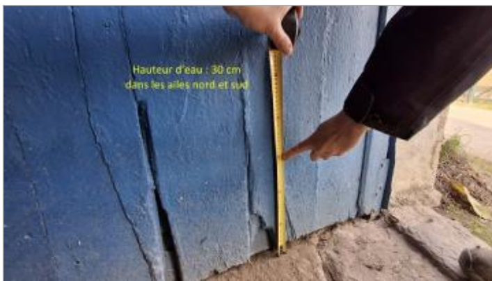
Niveau de l'inondation (30cm) dans les ailes nord et sud de la maison éclusière