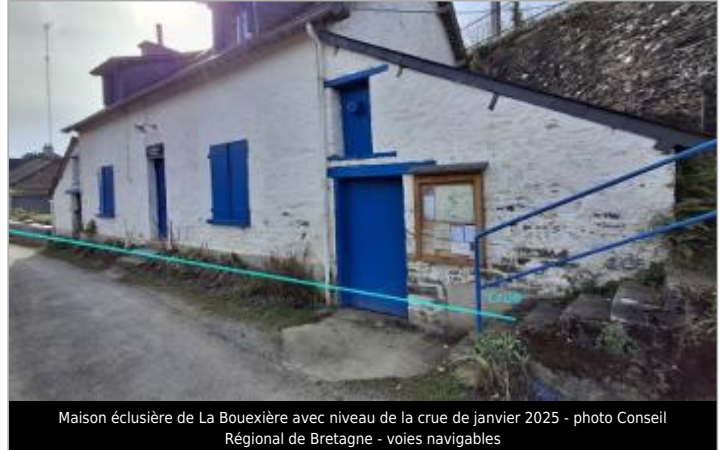
Maison éclusière de La Bouexière avec niveau de la crue de janvier 2025 - photo Conseil Régional de Bretagne - voies navigables