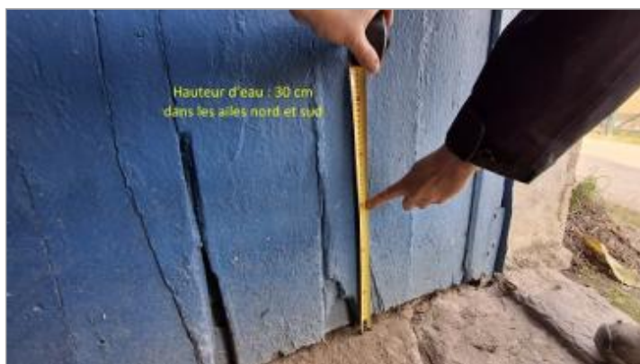
Niveau de l'inondation (30cm) dans les ailes nord et sud de la maison éclusière