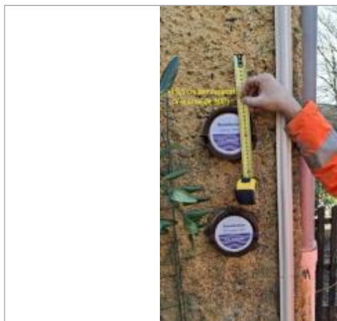
Différence entre la crue de 2025 et le repère de 2001

Altitude calculée de l'eau (en m) : 14.485 m