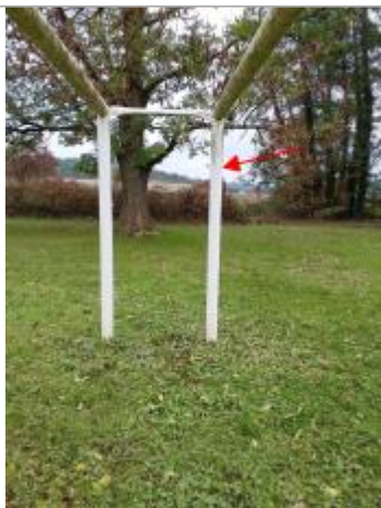
Photo du repère - SPC SMYL