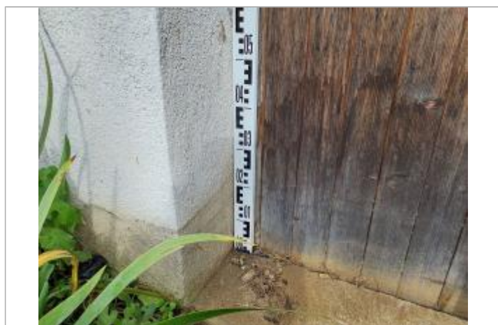
Photo du repère - SPC SMYL

Altitude calculée de l'eau (en m) : 65.6 m