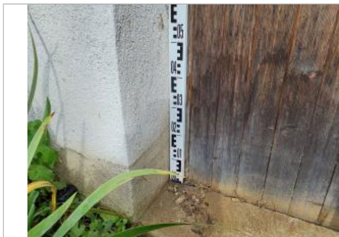
Photo du repère - SPC SMYL

Altitude calculée de l'eau (en m) : 65.6 m