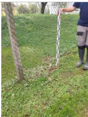
Photo du repère - SPC SMYL