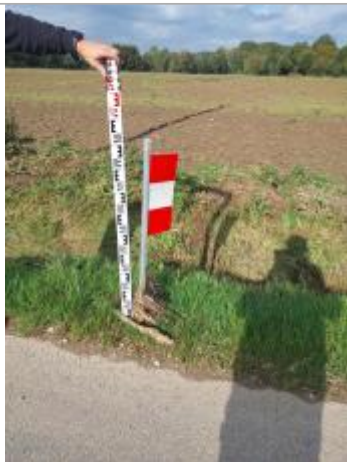
Photo du repère - SPC SMYL