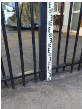
Photo du repère - SPC SMYL