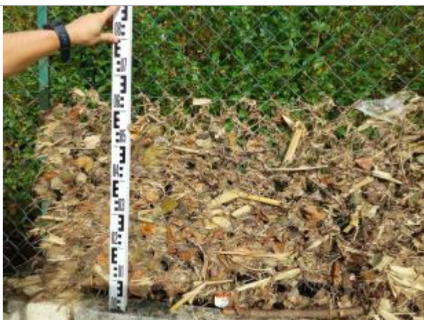
Photo du repère - SPC SMYL

Altitude calculée de l'eau (en m) : 52.17